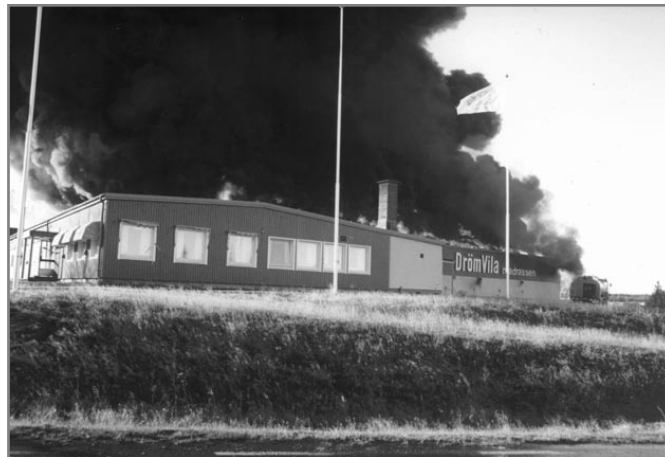
Branden 1991 var förödande, och företaget tvingades för en period att lämna Sikeå. Fyra år senare var man dock tillbaka i nya lokaler i byn. De gamla övertogs av Sikeå Plåt & Smide.

Ett klipp från 22-11-1957 när Sikeå Manufaktur firar 10-årsjubileum – då kunde man beställa sängar kompletta till ett pris av 341 kronor inklusive skumgummimadrass. Dessutom omfattade sortimentet täcken, filter, kuddar, gardiner, bomullstyger, yllevävnader, regnkläder, fritidskläder, blåkläder, underkläder, triksåvror, skjortor, slipsar, handskar, vantar, scarves, cardigan, pullovers, västar, damblusar, strumpor, kofter, jumpers, korsetter, BH, handarbeten, dukar, handdukar, bijouterier, shopping-väskor, sybehör och mönster, m m.